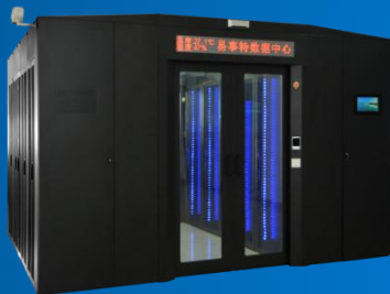
数据中心基础设施