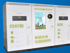
智能垃圾分类回收系统